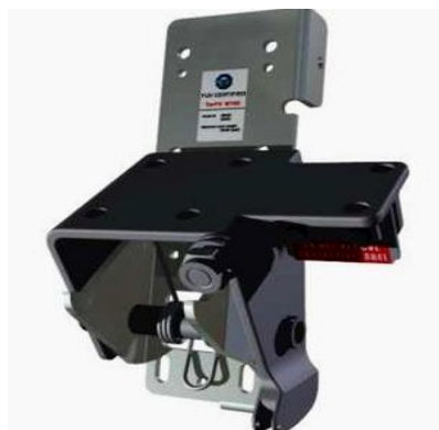
Apsauga nuo trosų trūkimo

Lūžus spyruoklei, apsaugo vartų plokštumą nuo kritimo žemyn bei žmones, esančius prie vartų. Užtikrinant maksimalų naudojimo saugumą visi mūsų gaminami ir tiekiami vartai aprūpinti apsaugomis nuo spyruoklių lūžimo.